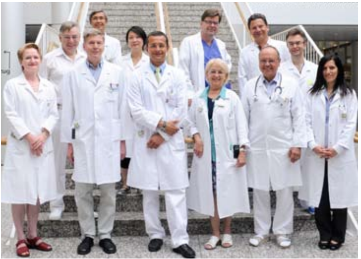
Das ärztliche Team der Klinik für Strahlentherapie und Radioonkologie

Die heutige Therapie bei Brustkrebs besteht in der Regel aus der Operation, der Behandlung mit Medikamenten (z.B. Hormonen, Chemotherapie, Antikörpern) und der Strahlentherapie. Dabei ist die Strahlentherapie nach der Operation die wirksamste Methode, um ein lokales Wiederauftreten des Tumors (Rezidiv) zu verhindern, und verringert auch das Risiko, an Tochtergeschwülsten (Metastasen) zu erkranken. Art und Durchführung der Strahlentherapie als Bestandteil eines multimodalen Therapiekonzeptes werden interdisziplinär in wöchentlichen Tumorkonferenzen festgelegt. Die Klinik für Strahlentherapie und Radioonkologie und das Medizinische Versorgungszentrum (MVZ) Strahlentherapie nehmen an den Tumorkonferenzen des Brustzentrums des Klinikums Stuttgart sowie der anderen wichtigen Brustzentren in Stuttgart und der Region teil.