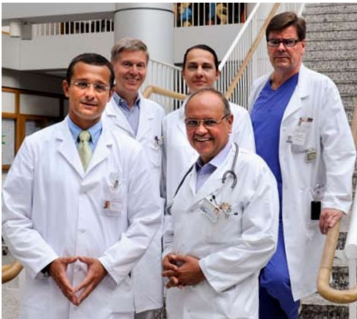
Das Behandlungs-Team für Patientinnen mit Brustkrebs